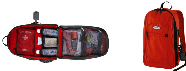
エマージェンシーイニシャルセット(モンベル)

缶詰の詰め合わせがもらえる“メイドと対決・ジャンケン大会”や、マイグッズを持参して缶に封入する“オリジナル缶づくり”、モンベル社による防災グッズ展示コーナーなどを展開します。